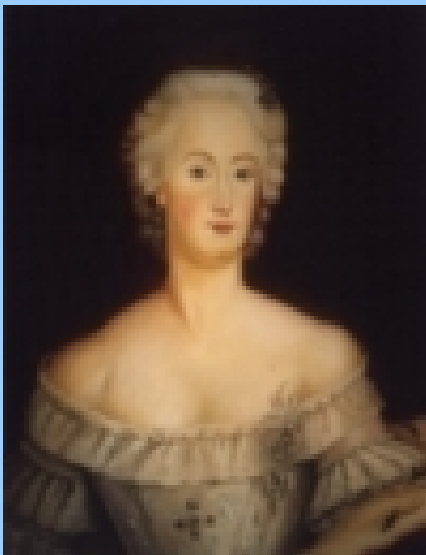
Elisabeth Christine von Preußen