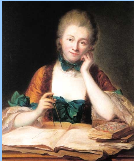
Emilie du Châtelet